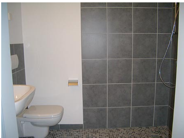
■ Bad (Duschbad)