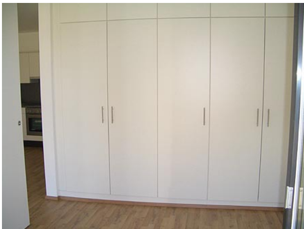
■ Schlafen (Einbauschränke)