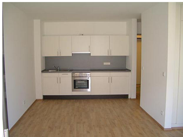
■ Wohnen, offene Küche