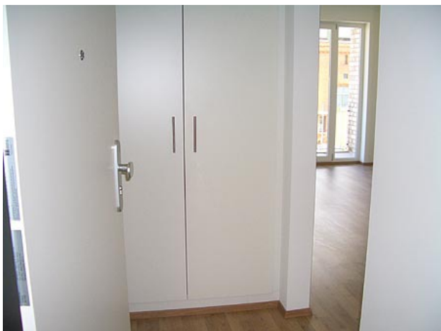
■ Eingang, Einbauschränk