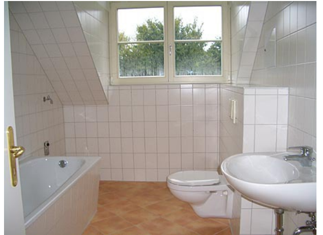
■ Bad mit Fenster