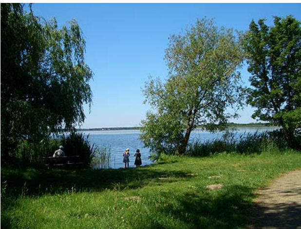
■ Am Blankensee