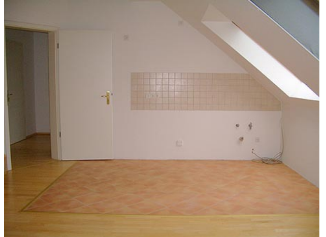
■ offene Küche