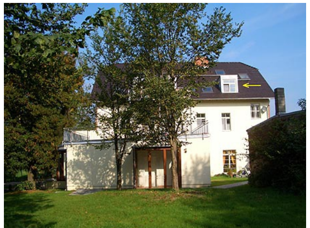
■ Haus Rückansicht