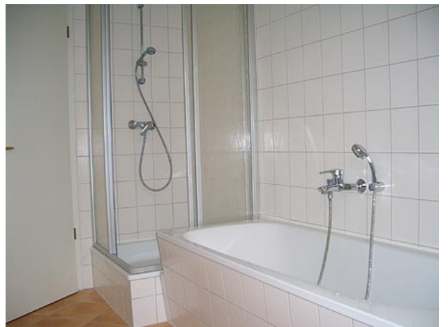
■ Dusche und Wanne