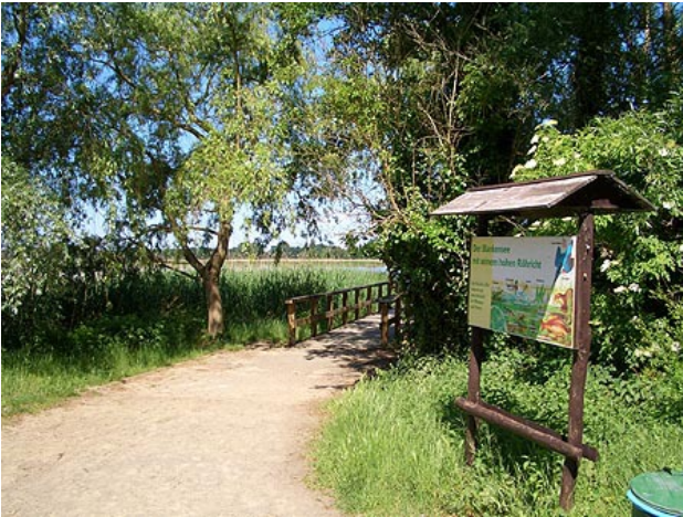
■ Weg zum Blankensee