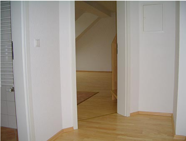
■ Eingang, Diele