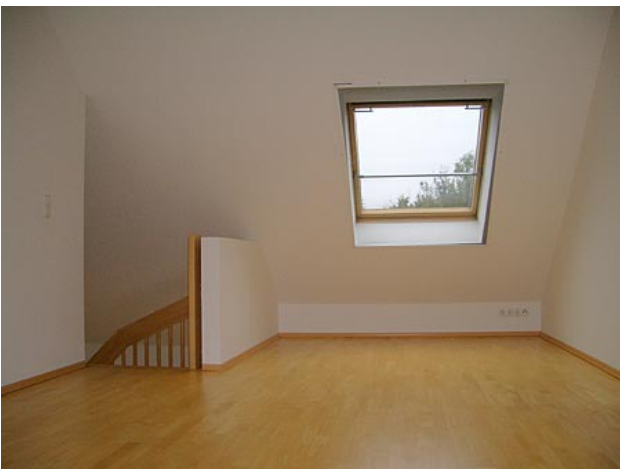
■ Schlafen (Ansicht 2)