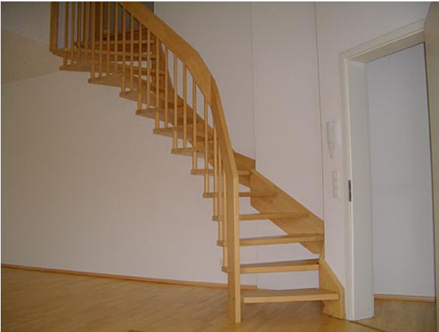
■ Holztreppe nach oben