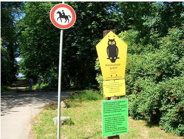
■ Weg zum Blankensee