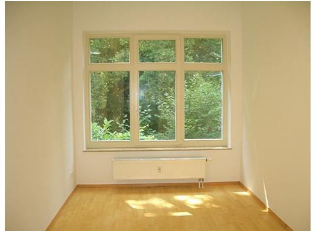
■ Wohnen / Essen