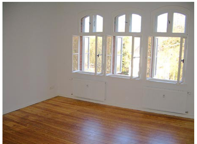
■ Wohnen (Ansicht 3)