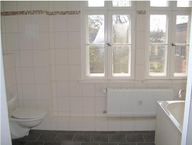
■ Bad (Wannenbad)