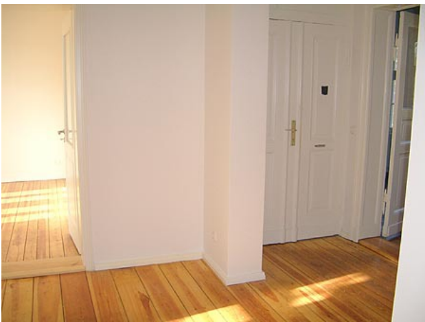
■ Diele (Ansicht 2)