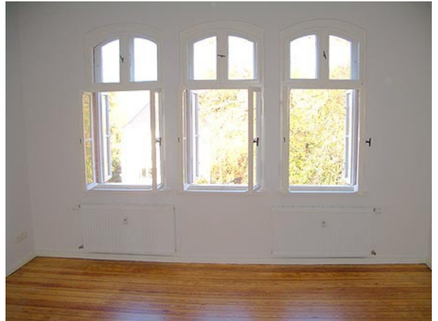
■ Wohnen (Ansicht 2)