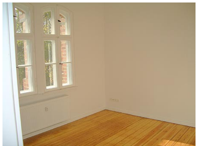
■ Kind (Ansicht 2)