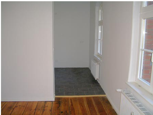
■ Küche, Essbereich