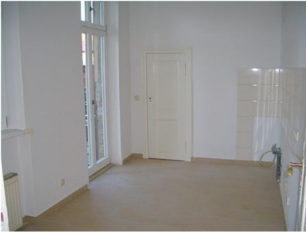
■ Küche (Balkon)