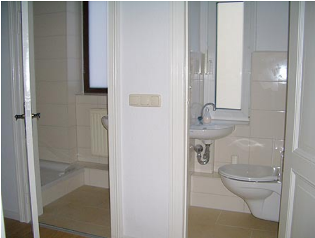
■ 2 Bäder (Dusche, WC getrennt)