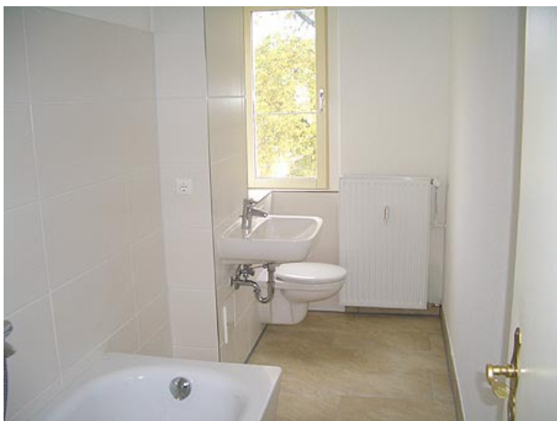
■ Bad (Wannenbad)