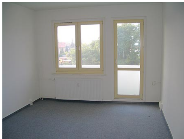
■ Wohnen, Balkon