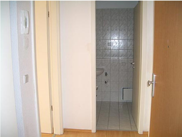
■ Diele, Eingang