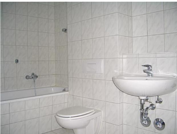
■ Bad (Wannenbad)