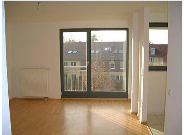
■ Wohnen, Küche, Balkon