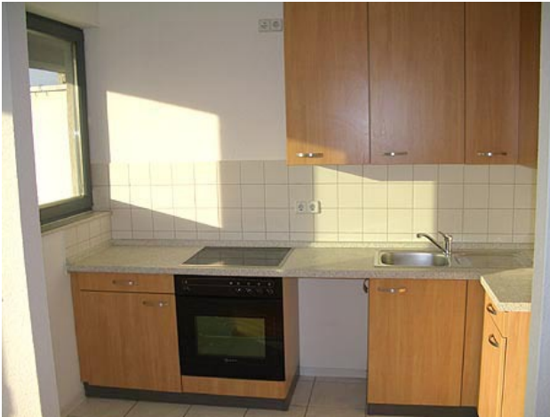
■ Küche (mit EBK)