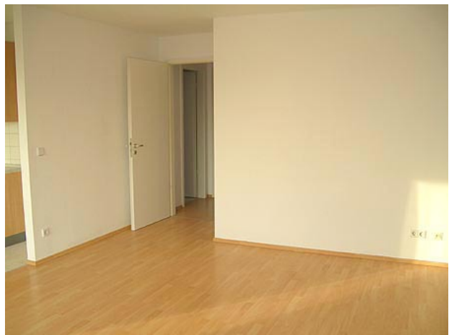
■ Wohnen (Ansicht 3)