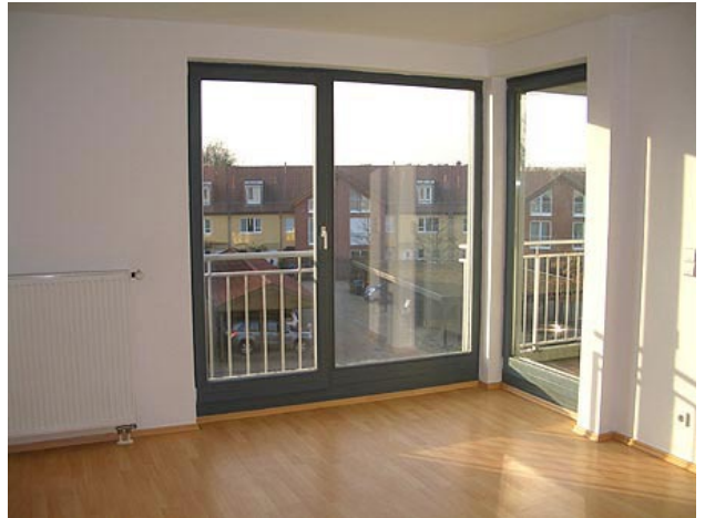
■ Wohnen (Ansicht 2)