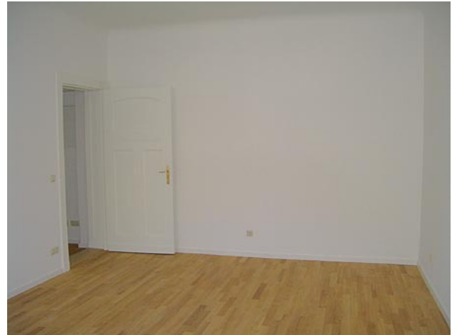
■ Wohnen (Ansicht 2)