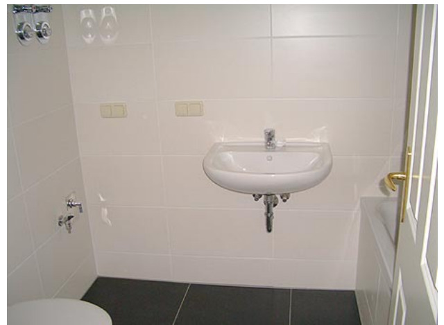
■ Bad (Wannenbad)