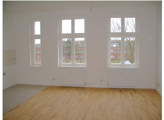
■ Wohnen (offene Küche)