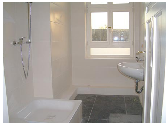
■ Bad (Duschbad)