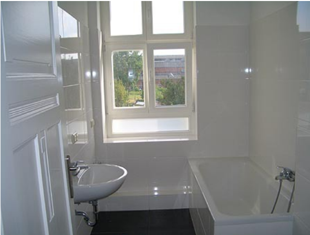
■ Bad (Wannenbad)