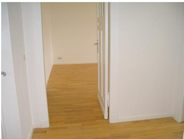
■ Diele (Eingang)