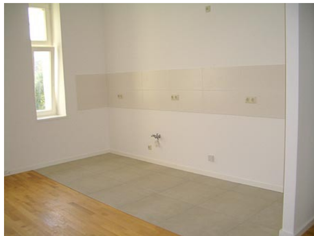
■ offene Küche