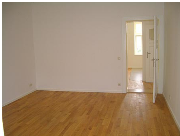
■ Schlafen (Ansicht 2)