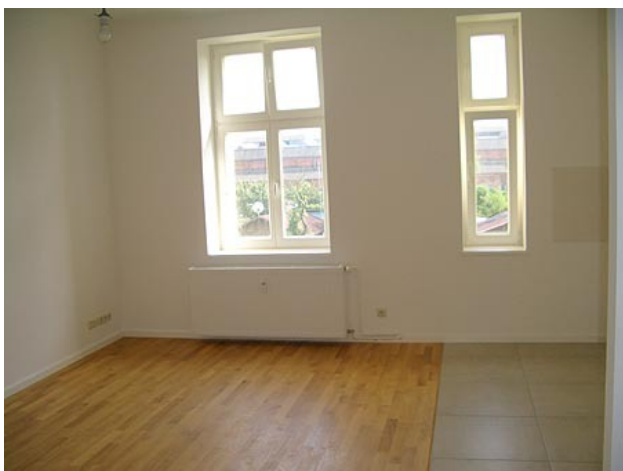
■ Wohnen, Küche