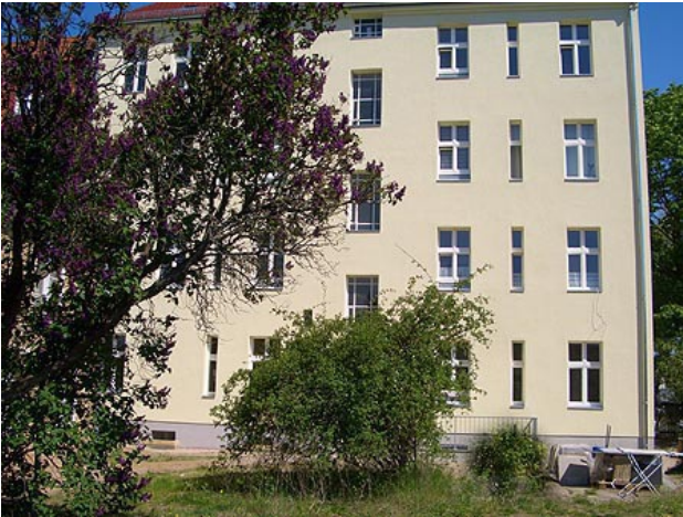
■ Hausansicht (Hofseite)