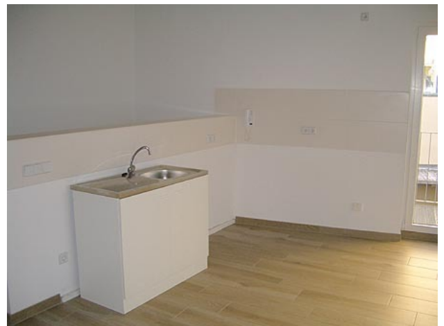
■ offene Küche