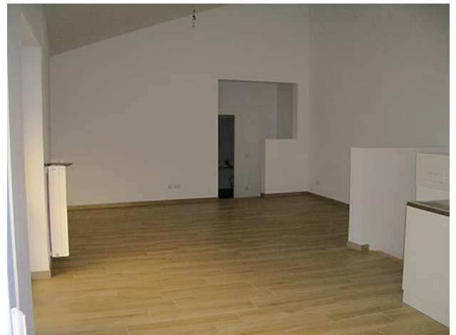
■ Wohnen (Ansicht 2)