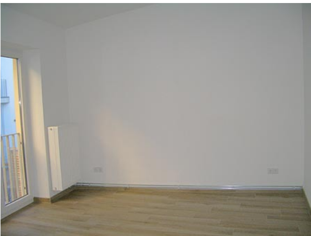
Schlafen (Ansicht 2)