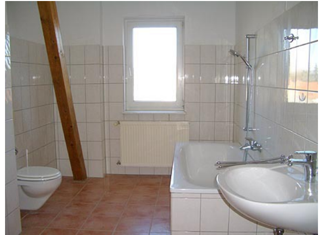
■ Bad (Wannenbad)