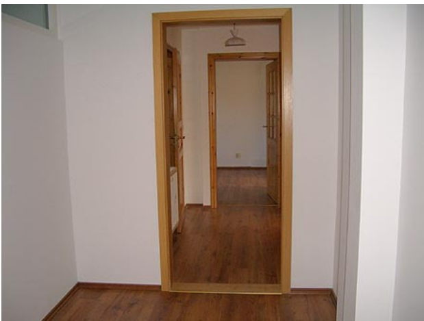
■ Flur, Diele