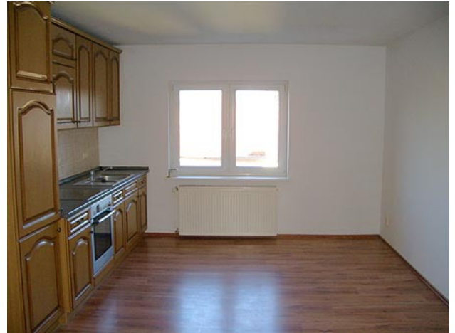
■ Küche (mit Fenster)