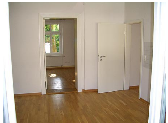
Küche (zentraler Punkt)