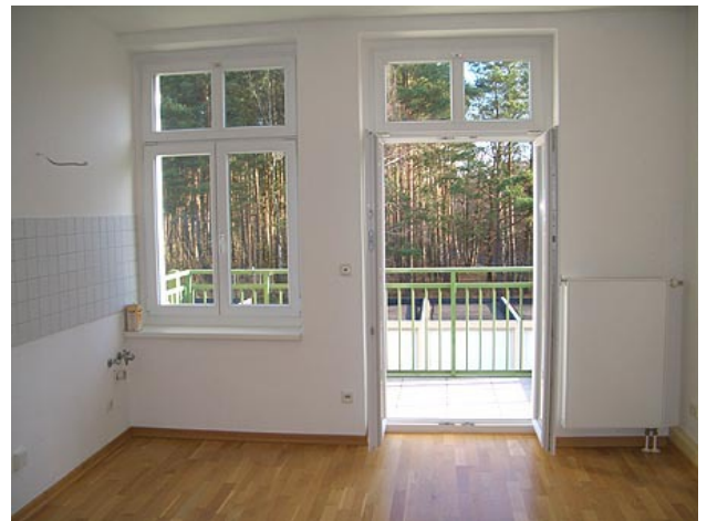
■ Küche (Balkon)