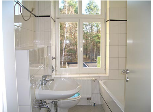
■ Bad (Wannenbad)