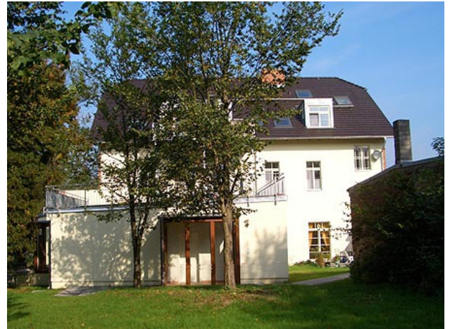
■ Haus (Rückseite)