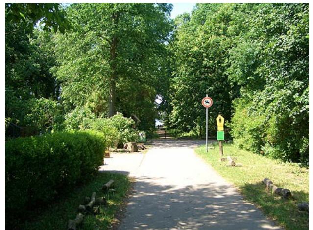
■ Weg zum Blankensee