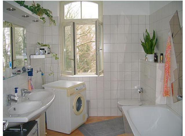
■ Bad (Vollbad)