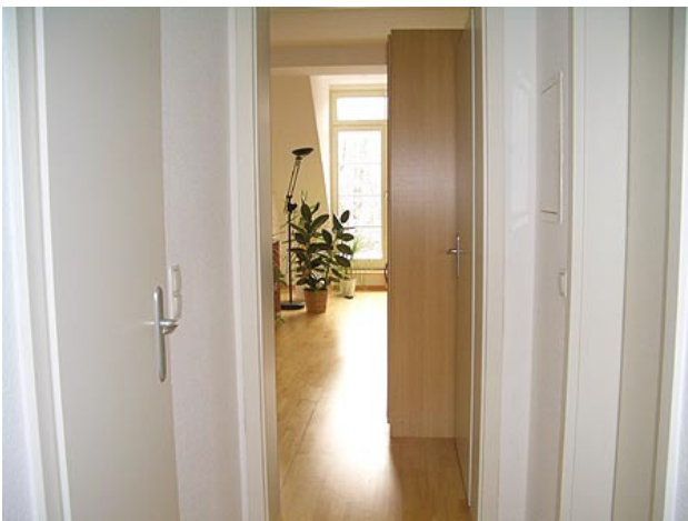
■ Flur (Wohnen/Schlafen)