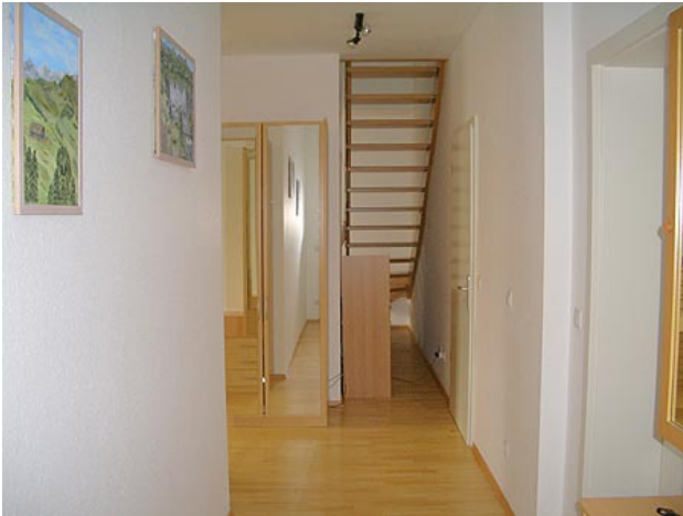
■ Eingang Diele