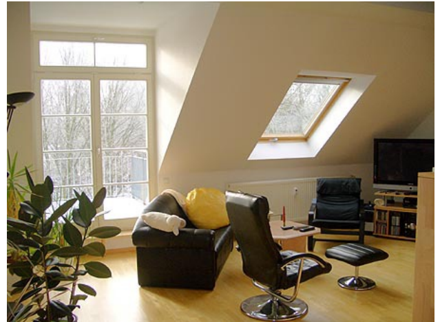
■ Wohnen (Zugang Terrasse)