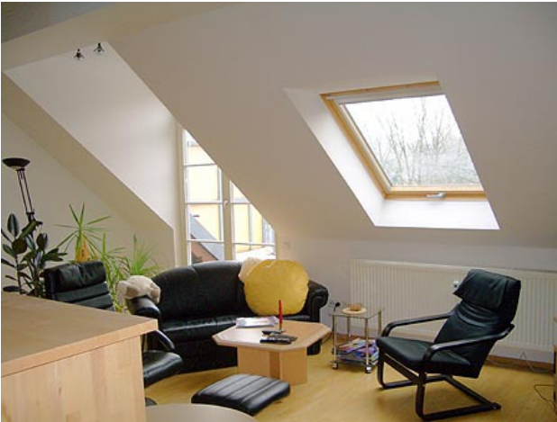
■ Wohnen (weitere Ansicht)