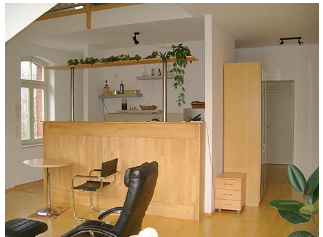
■ Wohnen (mit offener Küche)