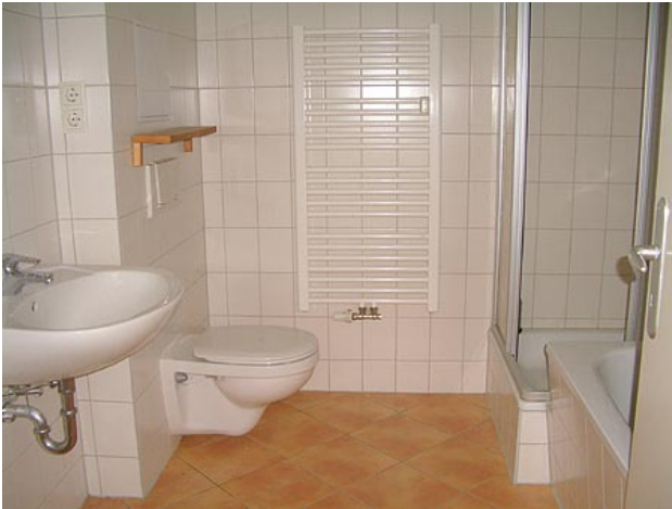
■ Bad (Vollbad)