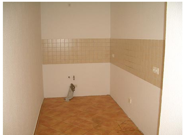
■ offene Küche