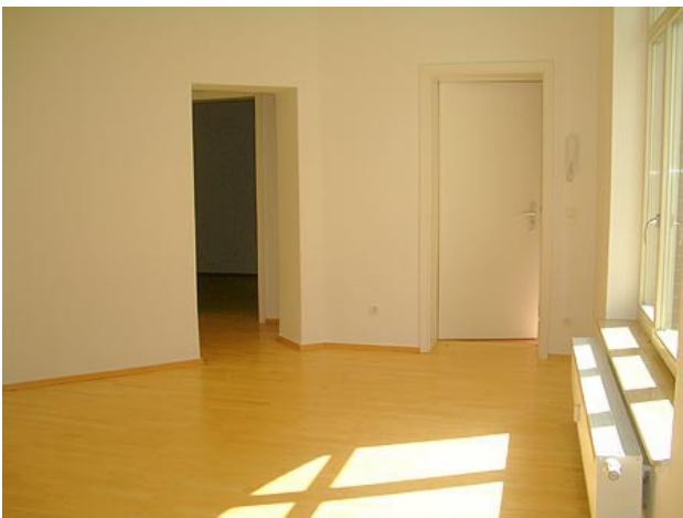
■ Wohnen (Ansicht 2)