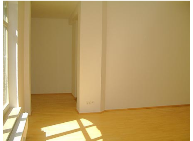
■ Wohnen (Ansicht 3)