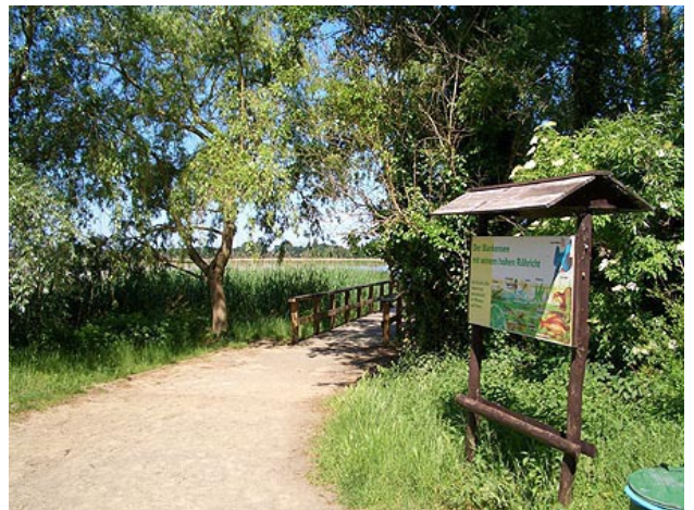
■ Weg am Blankensee