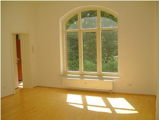
■ Wohnen (Ansicht 1)