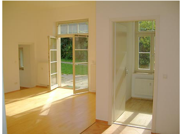
■ Wohnen (Ansicht 1)