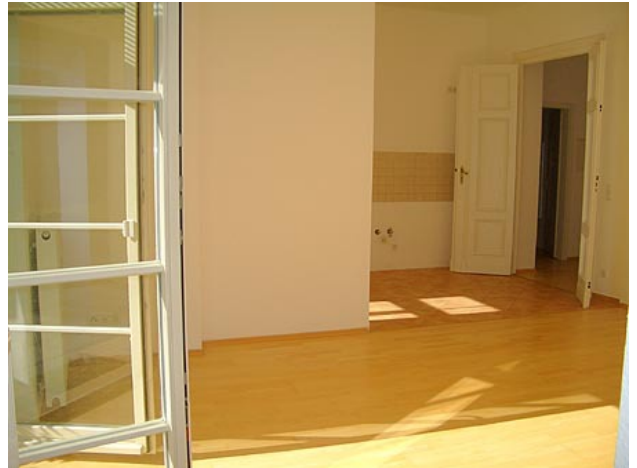
■ Wohnen (Ansicht 2)