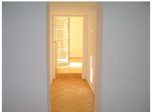
■ Flur (Wohnen, Arbeiten)