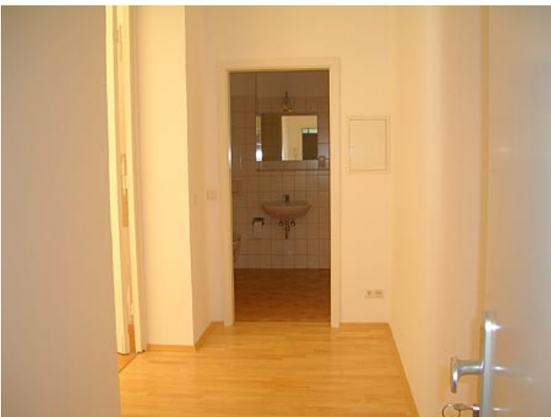
■ Eingang, Diele