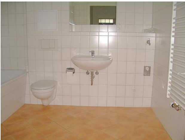
■ Ba (Vollbad)