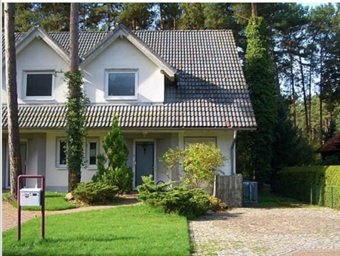
Eingang (Haus A)

Zimmer: 10,00 Wohnfläche ca.: 240,00 m 2 Kaufpreis: 330.000,00 EUR