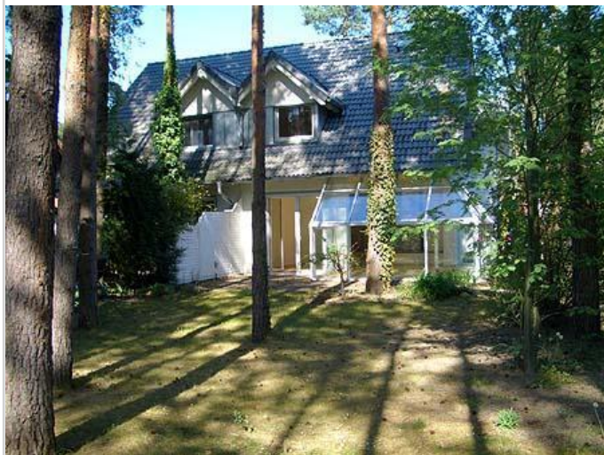
Garten (Haus B)