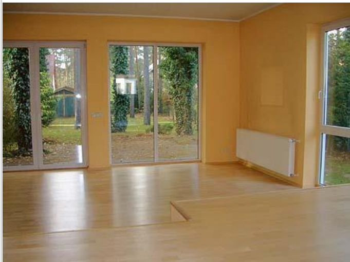
Wohnen (Haus A)

Zimmer: 10,00 Wohnfläche ca.: 240,00 m 2 Kaufpreis: 330.000,00 EUR