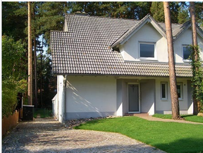
Eingang (Haus B)