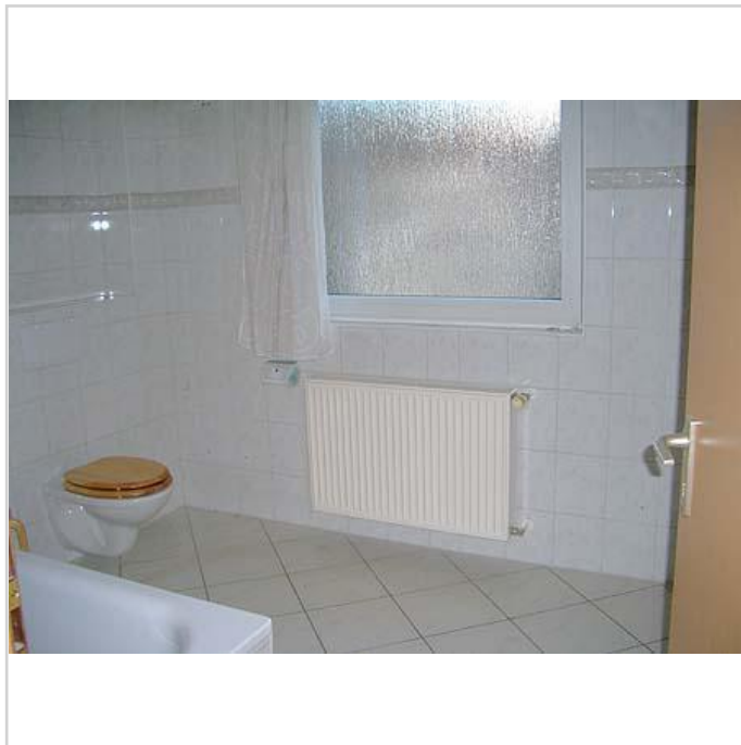
Bad (Haus B)