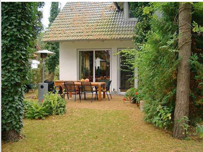
Terrasse (Haus A)