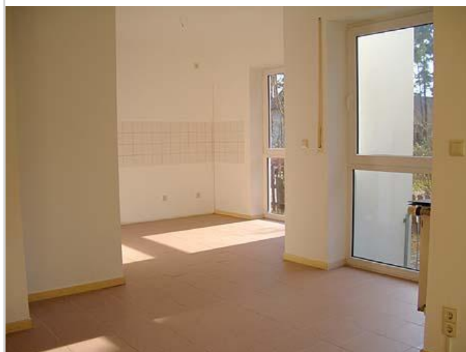
offene Küche (Haus B)