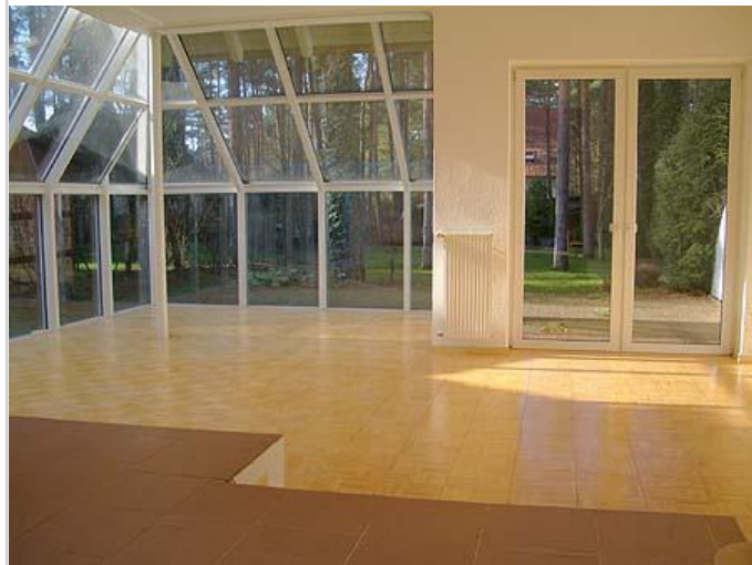
Wohnen (Haus B)