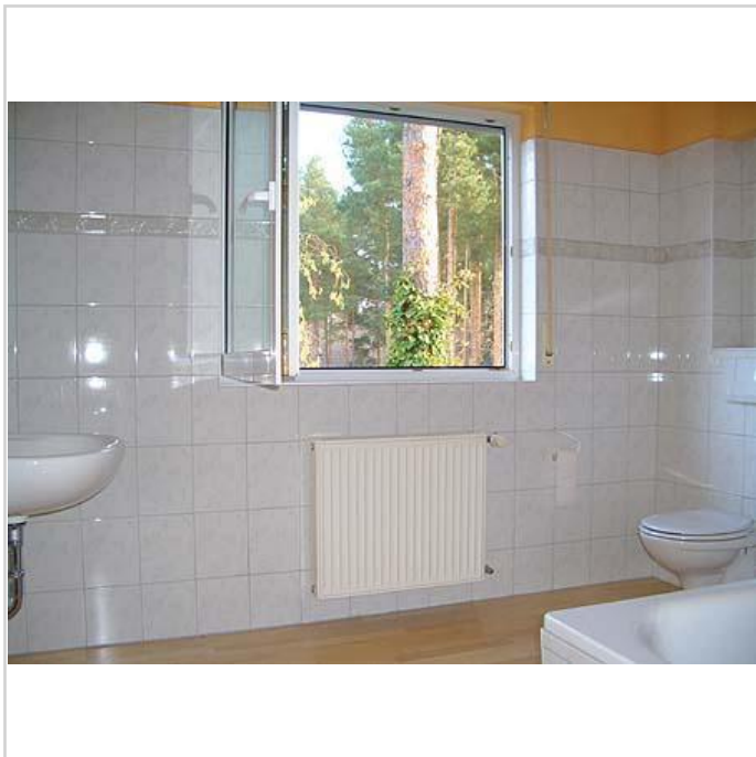
Bad (Haus A)

Zimmer: 10,00 Wohnfläche ca.: 240,00 m 2 Kaufpreis: 330.000,00 EUR