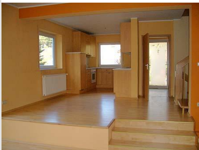
offene Küche (Haus A)