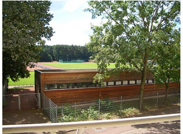
■ Ausblick Balkon