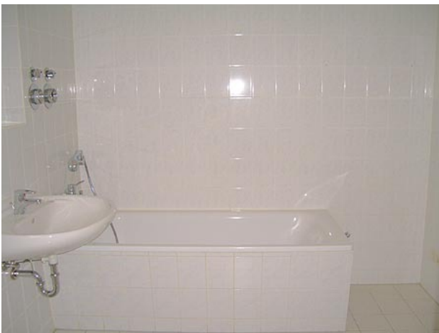
■ Bad (Wannenbad)